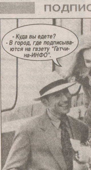
До 20 мая стоимость подписки на второе полугодие останется прежней. 9 тысяч рублей за полугодие (1500 рублей за месяц) для жителей Гатчины и Гатчинского района...